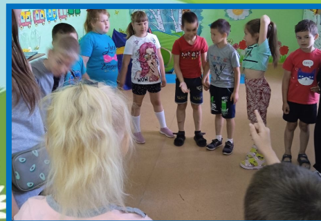
ИГРА НА СПЛОЧЕНИЕ «ВНИМАНИЕ К ДРУГУ»

Если выяснится, что кто-то неправ или оба, извиниться.