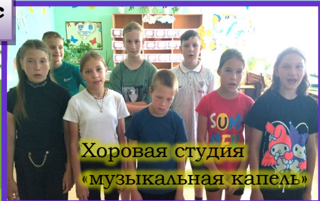
Хоровая студия «музыкальная капель»